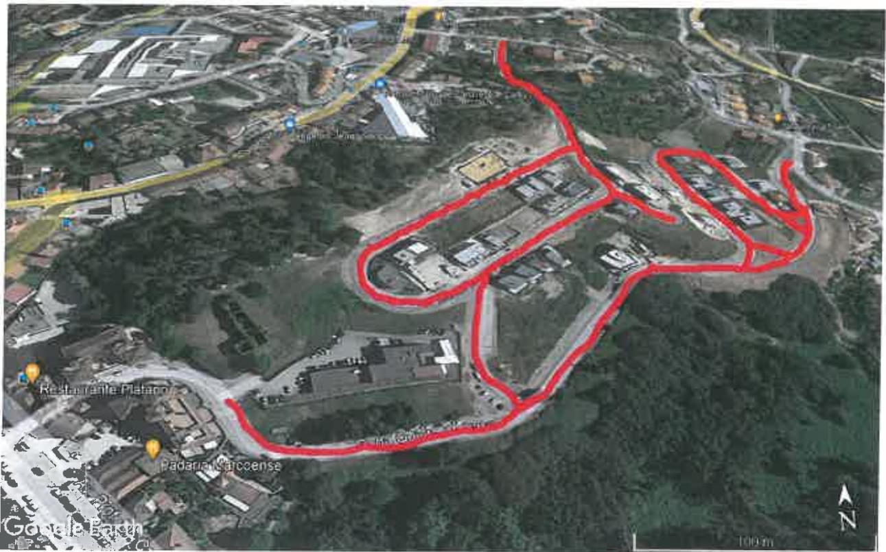
Urbanização do Casal