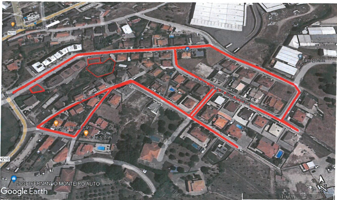
Urbanização do Monte