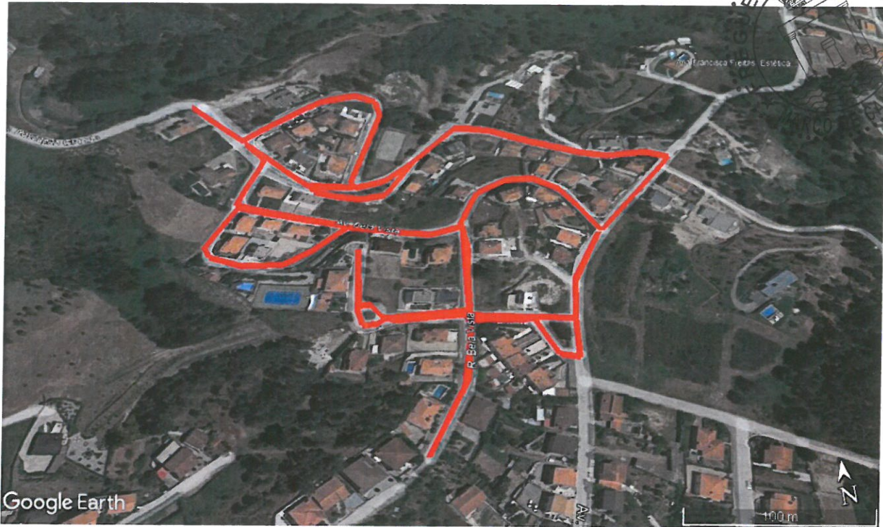
Urbanização da Povoação